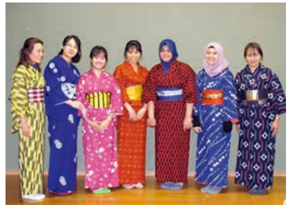
日本文化体験の着物体験は1番人気