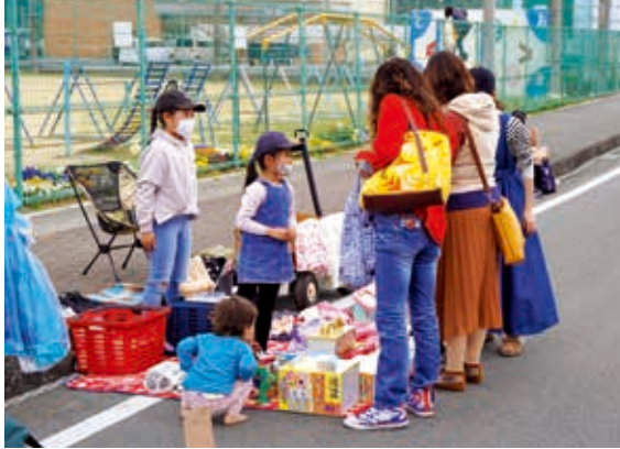
当日出店OKの子どもガレージセール 店長は子ども達