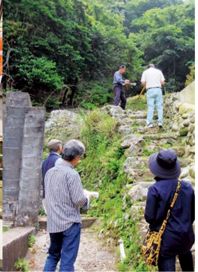
左上:2018年土砂かき支援 左下:2021年コロナ禍おにぎりづくり 右:2015年my防災マップ作り(ハザードマップのベースになった)