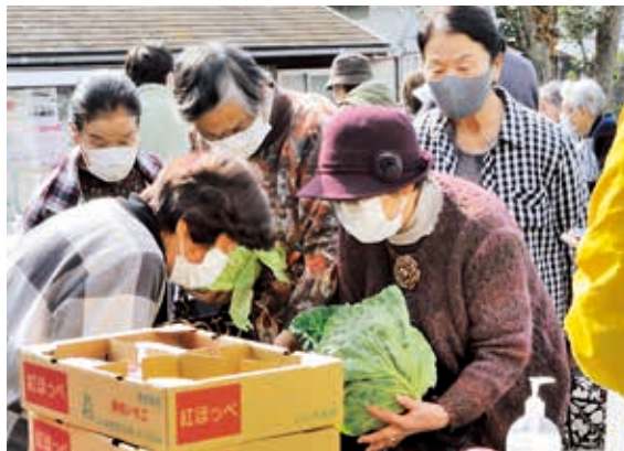
産地直送野菜は大人気