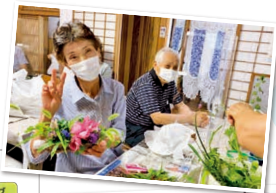
ふるさとカフェで開催した、フラワーアレンジ教室