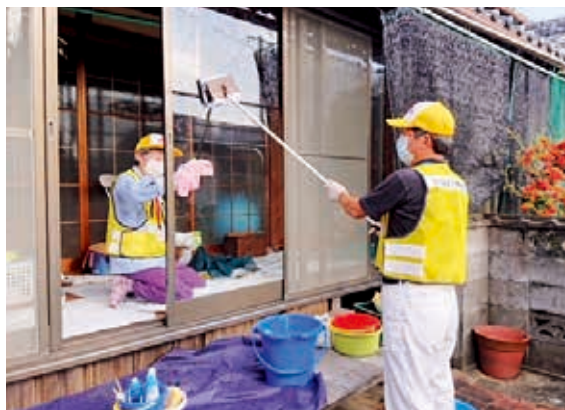
住民同士が支えあい住みよいまちづくりを目指す

▼令和2年4月に浅羽・笠原地区(8,000世帯)の住民を対象に日常生活でのちょっとした困りごとを支援する組織、浅羽・笠原生活支援ネットワークが発足した。役員5人、相談員12人、住民有志の支援員72人(兼任あり)で、利用登録者55人の掃除洗濯、ごみ出し、庭の草取り、植木の刈込、買い物代行、荷物の発送等に対応している。