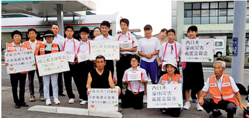
災害義援金の街頭募金活動。7月に伊豆山土砂災害被災地支援の街頭募金を行った